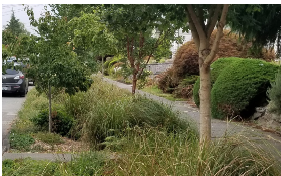
一個在住宅街道上已完工的自然排水系統。