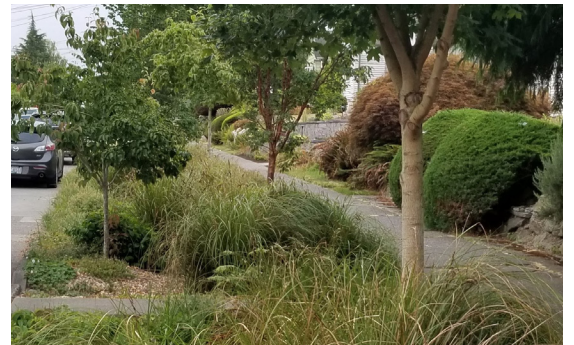
نظام صرف طبيعي مكتمل على شارع في منطقة سكنية.