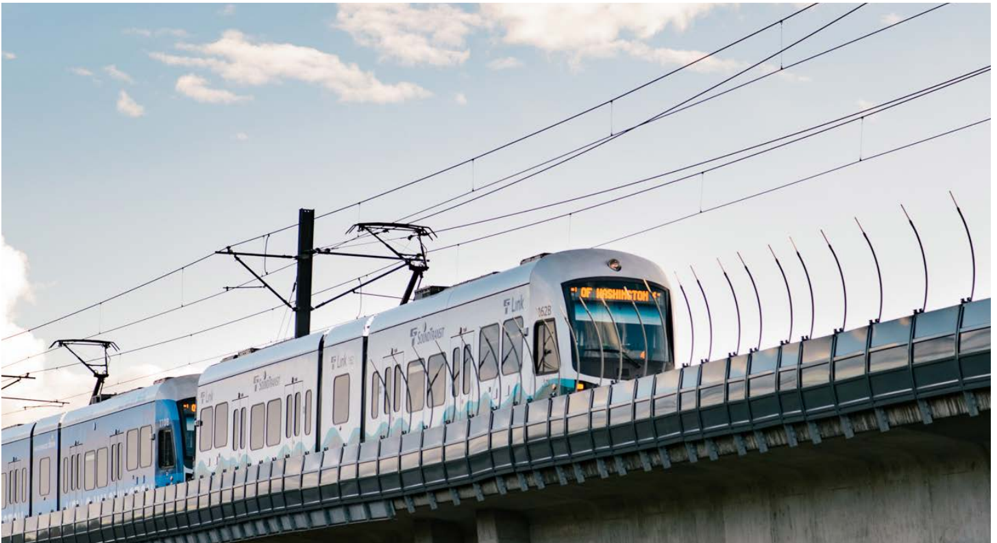
轻轨即将开通至 NE 130th 和 I-5 公路