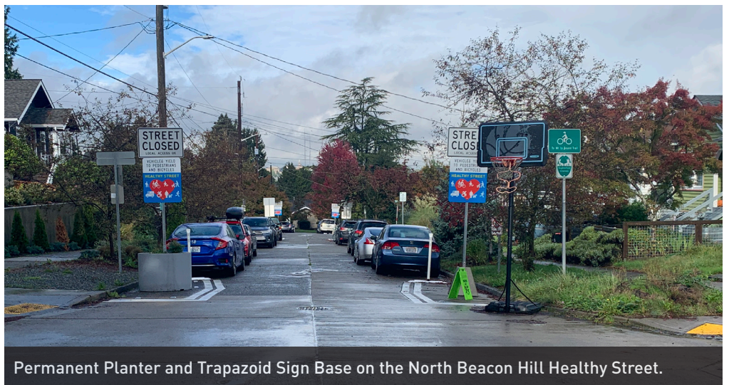
Permanent Planter and Trapazoid Sign Base on the North Beacon Hill Healthy Street.