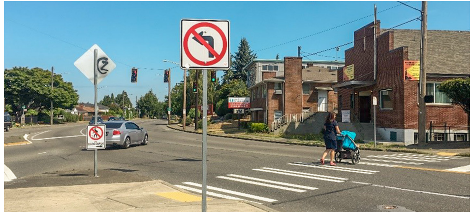
Gagawa ng mga pagpapahusay sa kaligtasan sa interseksyon ng 15th Ave S, S Columbian Way, at S Oregon St.

Nagbibigay ang 15th Ave S na mula sa S Spokane St hanggang sa S Angeline St ng isang mahalagang koneksyon para sa mga taong pumupunta o dumaraan sa Beacon Hill. Magsasagawa ang Kagawaran ng Transportasyon ng Seattle (Seattle Department of Transportation, SDOT) ng mga pagpapahusay sa pasilyong ito na magbabalanse ng mga pangangailangan ng lahat ng mga gumagamit para makarating ang lahat sa kung saan nila kailangang pumunta nang ligtas at maginhawa.